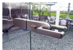
ステンレス製レバーハンドル