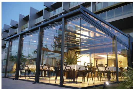
高齢者施設とは思えない、まるでリゾートのお洒落なカフェ空間(カフェ・レストラン「空音 CAFE KU-ON」)