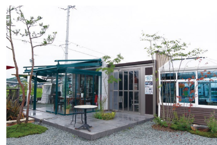
鈴鹿展示場では常設展示されている

ガラスハウスの一番の特長は、国産では不可能な大きなサイズが製作可能であること。そして、240色以上のカラーチョイスが可能であることだ。そのため和洋問わず、建物のデザインや敷地の形状に合わせた施工ができる。また側面のガラスパネルは可動式で全開放