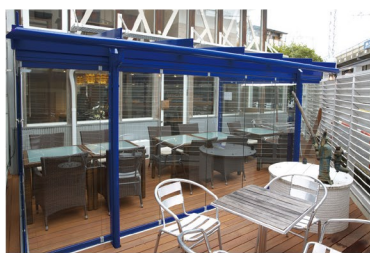
屋外のテラスをガラスハウスでリニューアルした京都・大山崎にあるカフェ&レストラン「ハーミットグリーンカフェ」